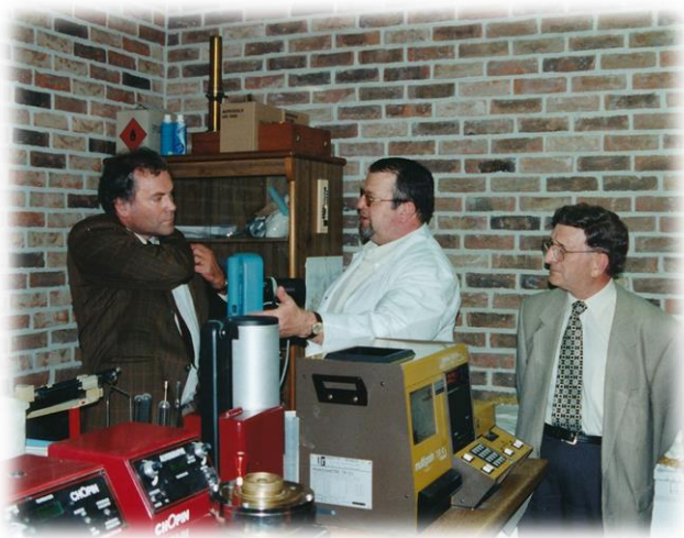
Hoge gasten bij de inhuldiging van de nieuwe vleugel (1996)

Als je nog eens langs Wastiels langs loopt, moet je zeker eens kijken naar de rechter voorbouw. Daar kun je een merkwaardige haan zien staan. Deze sierde ooit de maalderij De Kroon.